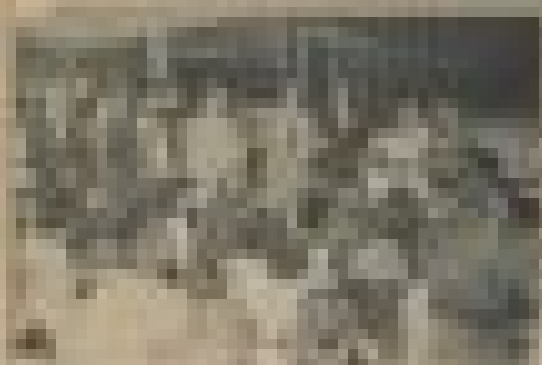
Ministros da Educação participam do evento